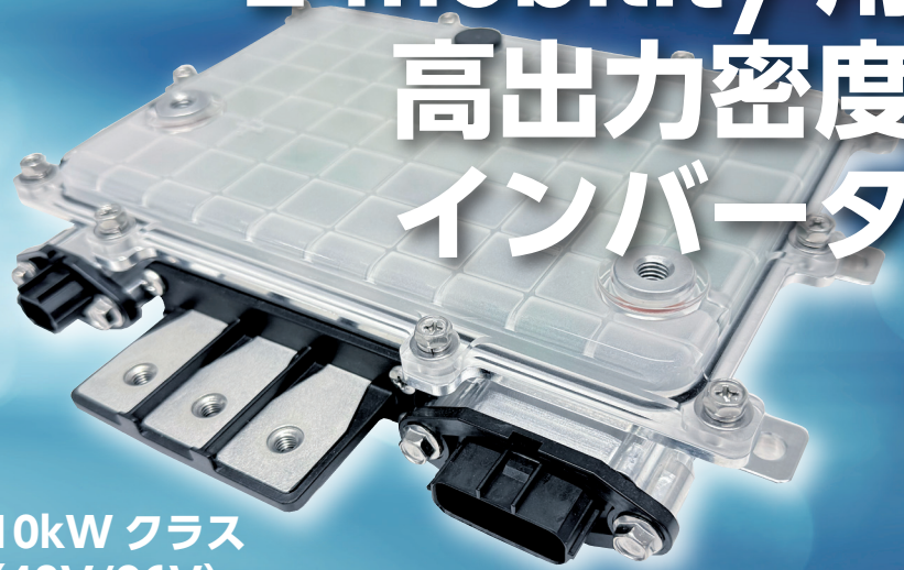
10kW クラス (48V/96V)

車載品向けパワエレ製品設計・製造のノウハウをベースに小型車両向けインバータを開発 48V/96V、5～10kW 出力のモーターと組合せ可能