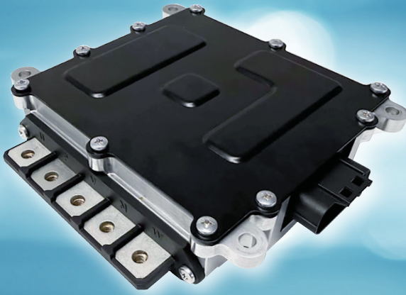
6kW クラス (48V)